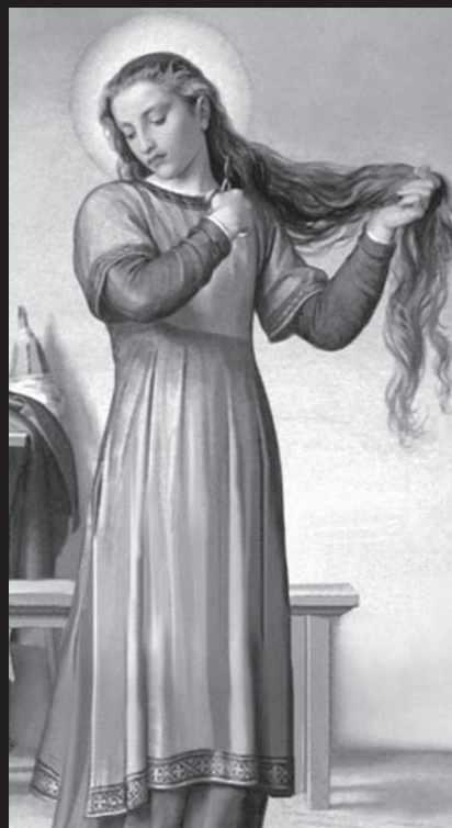
Alessandro Franchi Sv. Kateřina Sienská si stíhá vlasy (detail)