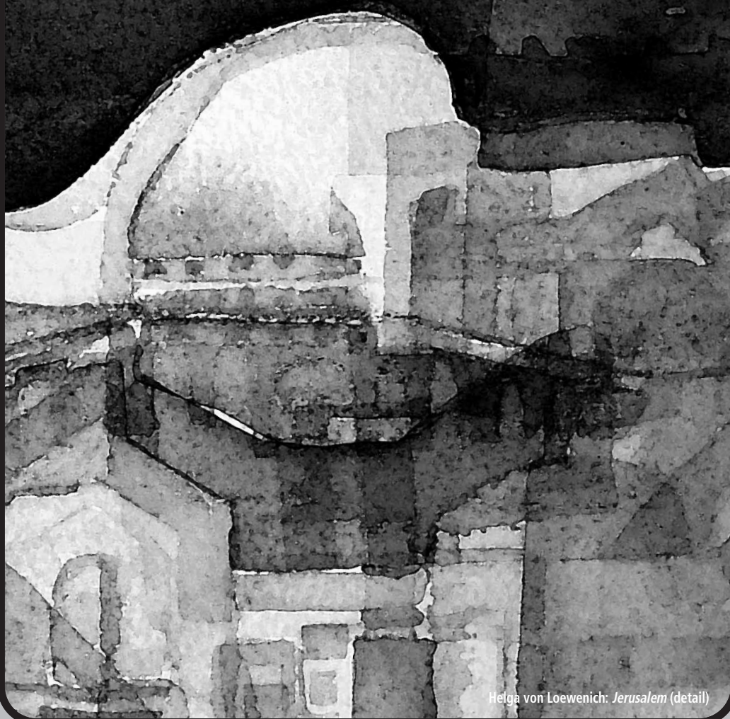
Helga von Loewenich: Jerusalem (detail)